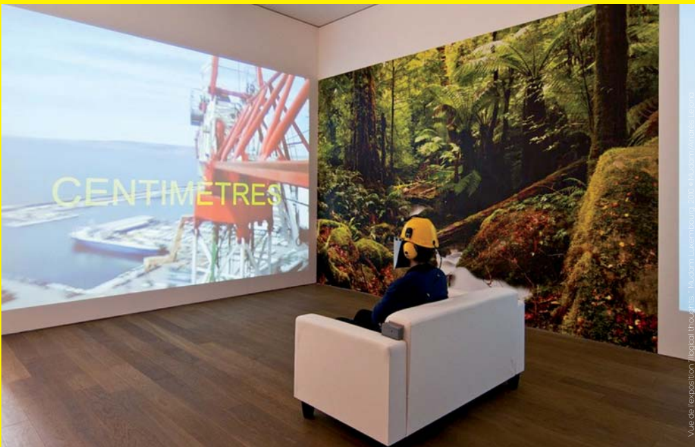
Vue de l'exposition "loged thoughts" de Antoine Defoort, 2011 • Kolumba, Luxembourg