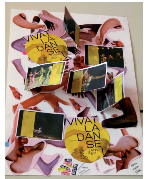
Une des affiches du festival "customisées" par des spectateurs et présentées dans le hall

Autant de possibilités pour les spectateurs, habitués ou non, d'aller plus loin que le simple spectacle. En terme de fréquentation, ces actions ont drainé à chaque fois des groupes de 15 à 30 personnes, chacun vivant une expérience différente, proche des artistes, en complicité.