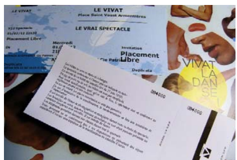
Il faut toujours bien lire... surtout les textes écrits en petit !

Hier soir, la clôture du festival Vivat la danse ! a été perturbée. L'hiver s'est invité à la soirée tel un hôte perturbateur. Manquait une partie des figurants, coincés sur la route quelque part entre la neige et le verglas. Peut-être étaient-ils partis à la recherche du public de Lille, délaissés par une navette perdue dans le vide de l'espace hivernal. Tout cela prête à rire, bien sûr. Reste que pour l'institution organisatrice de la soirée, ce furent de réelles difficultés.