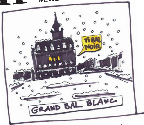
"LE BAL NÈGRE"