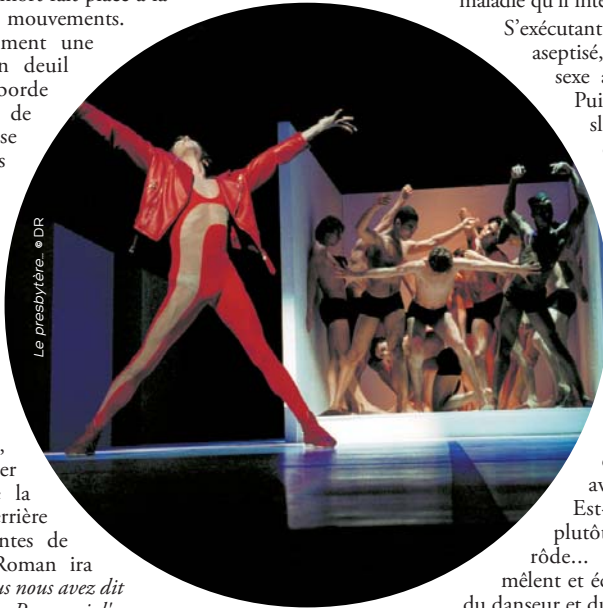
Le presbytère.